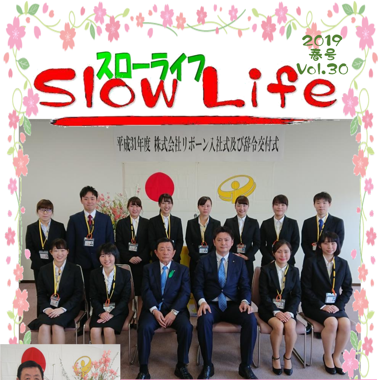
平成31年度 株式会社リボーン入社式及び辞令交付式