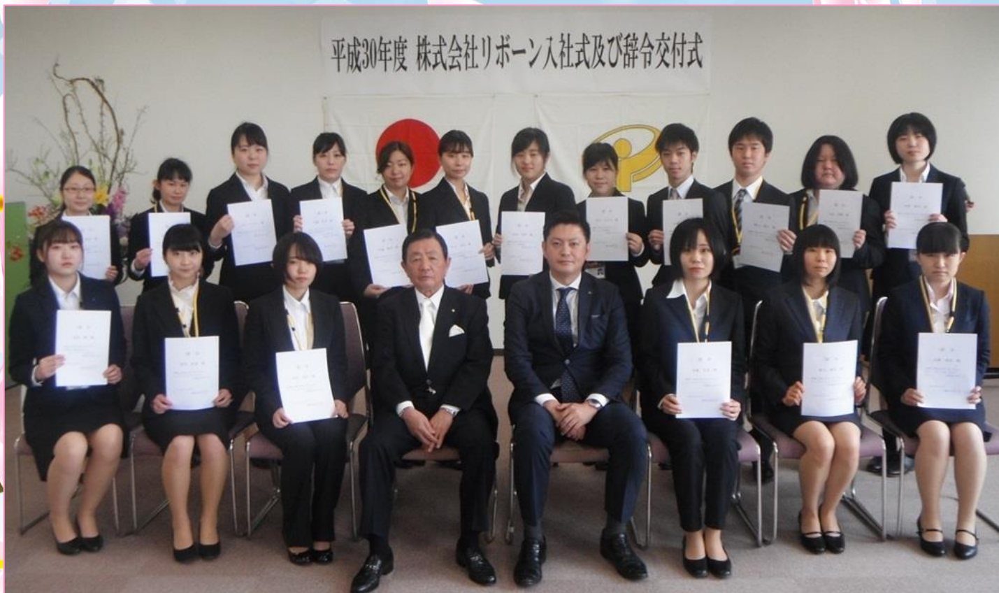
平成30年度 株式会社リボーン入社式及び辞令交付式