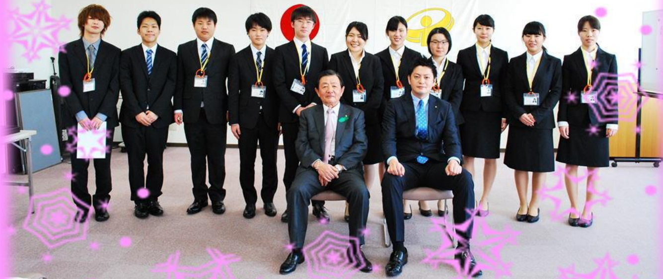
平成28年度 株式会社リボン入社式